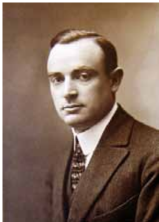
Figura 1. Foto de Julio Palacios (1916), tras acceder a la cátedra de termología de la Universidad de Madrid.

Ciencias de la Universidad y continuó con sus investigaciones en el Laboratorio de Investigaciones Físicas de la JAE. En 1919 publicó sus primeros artículos sobre isoterma del neón, desde 10 °C a -217 °C, en colaboración con H. Kamerlingh Onnes y C. A. Crommelin. 3